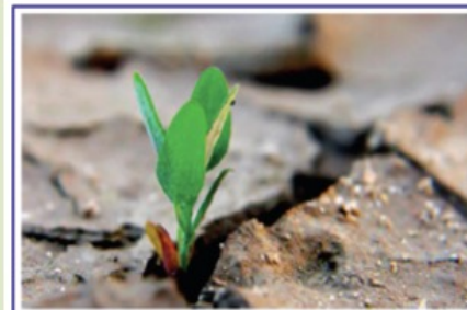
Il Biologo nel settore ambientale