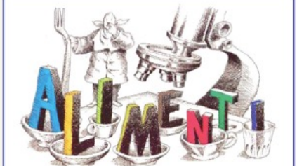
Il Biologo e l'igiene degli alimenti