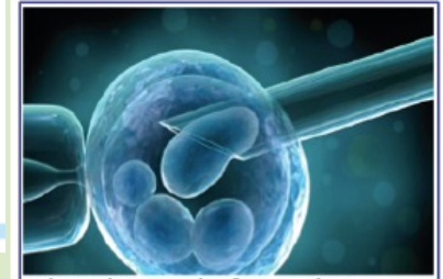
Il Biologo e la fecondazione assistita