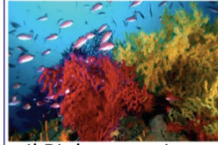
Il Biologo marino