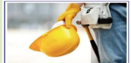
Il Biologo esperto in Sicurezza e Qualità