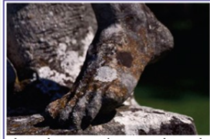
Il Biologo e i beni culturali