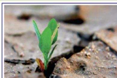
Il Biologo nel settore ambientale