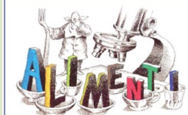
Il Biologo e l'igiene degli alimenti