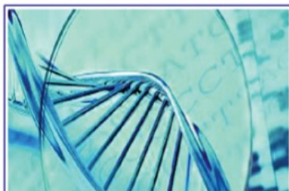
Il Biologo e la genetica forense