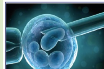
Il Biologo e la fecondazione assistita