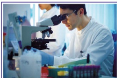
Il Biologo in ambito sanitario