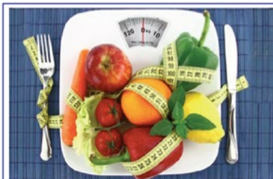
Il Biologo nutrizionista