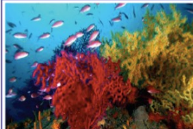
Il Biologo marino