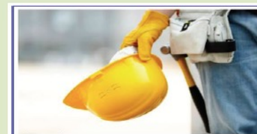
Il Biologo esperto in Sicurezza e Qualità